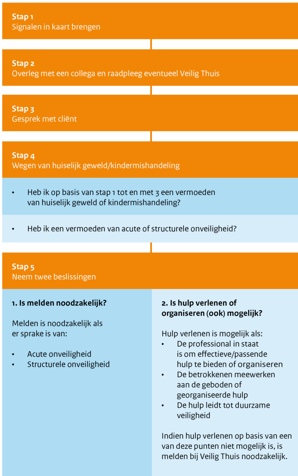
Figuur 1: Stappenplan verbeterde meldcode