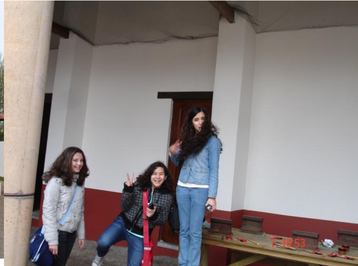
Brugklas gymnasium 2008/2009, in Archeon en in de klas